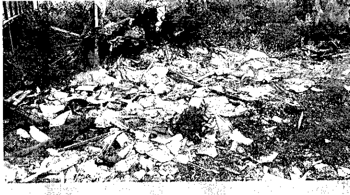
Foto 4. Zona de disposición final de los residuos hospitalarios

"Por medio de la cual se impone una medida preventiva y se ordena el inicio del Procedimiento Sancionatorio Ambiental en contra de la Secretaria de Salud Departamental