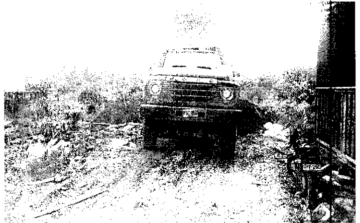
Foto 3. Vehículo en la cual se transportaron los residuos hospitalarios con material de relleno para la zona

Los RESPEL fueron depositados en una zona propicia de inundación por el aumento del nivel del agua del Rio Atrato y la Microcuenca del Rio Cabí, en esta área hay viviendas residencial con alta presencia poblacional, especialmente niños, los cuales se encarga de manipular en el caso de revolver los desechos que están en este lugar.