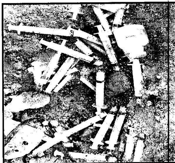
Foto 1. Disposición inadecuada de residuos hospitalarios - Cortopunzantes